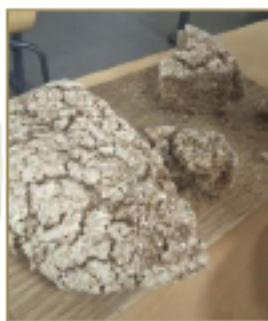
ヨーロッパのある地域ではパンを木造建築に活用している。

第一回目の講義は「フードロス×木造建築」というテーマで、「ヨーロッパのまちづくりと木造建築」について法政大